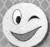
Смайлик с улыбкой красной