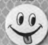
Смайлик с языком