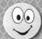
Смайлик с глазами