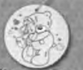
Мишка с зайцем