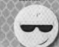
Смайлик в очках