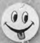
Смайлик с языком