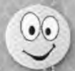
Смайлик с глазами