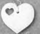
Сердце в сердце