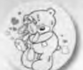
Мишка с зайцем